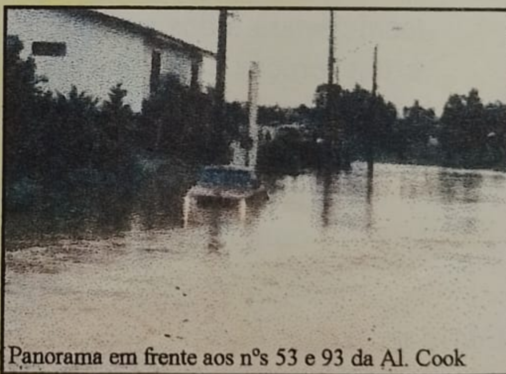
Panorama em frente aos nºs 53 e 93 da Al. Cook

A principal causa para estes danos, além da intensidade das chuvas, foi o córrego que passa aos fundos do colégio Objetivo, que teve sua capacidade de escoamento esgotada sob a Av. Alphaville, represando as águas, forçando seu retorno para dentro de nosso Residencial.